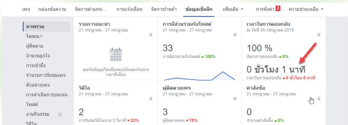
รูปที่ 3 หน้าจอเวลาเฉลี่ยในการตอบปัญหาให้กับผู้ใช้งาน

โดยมีสถิติในการตอบกลับของเจ้าหน้าที่เมื่อมีการสอบถามเข้ามา เวลาปัจจุบันอยู่ที่ 1 นาที ดังปรากฏตามรูปที่ 3